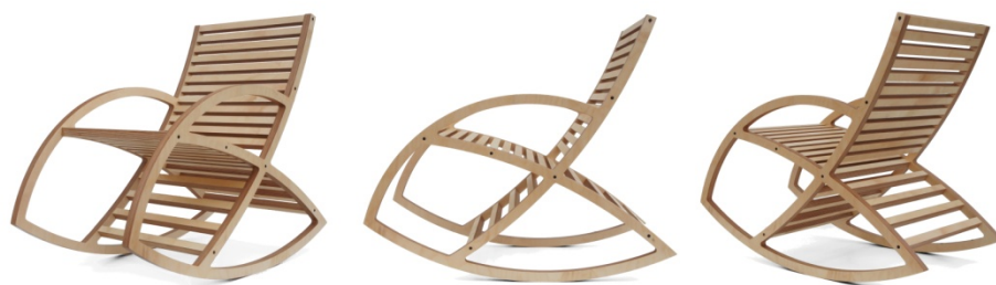
l'ARC de bedoll natural, visió en rotació de 90°.